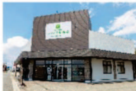
さがみ典礼の家族葬 ファミラル高松