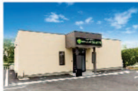
さがみ典礼の家族葬 ファミラル三ツ割