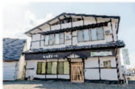
さがみ典礼の家族葬 ファミラル月が丘