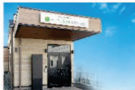
さがみ典礼の家族葬 ファミラル盛岡中央通