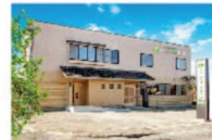
さがみ典礼の家族葬 ファミラル南矢幅